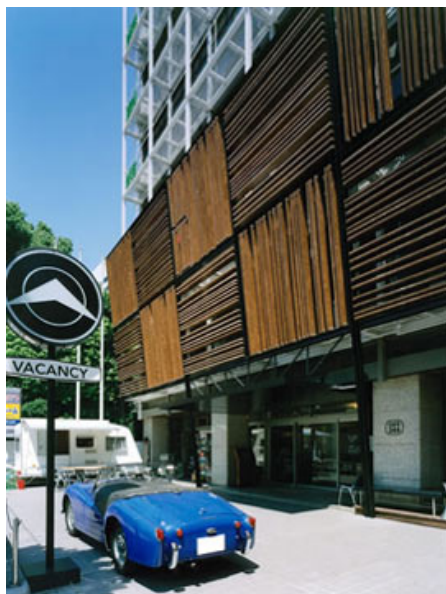
青山一丁目駅あがってすぐのロケーション!