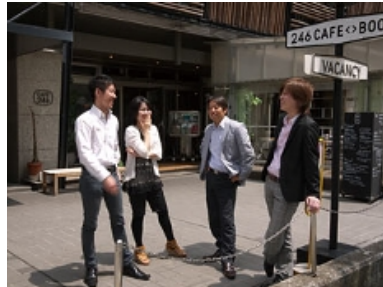
社長(どれ?)含む主要メンバーでばっちり!