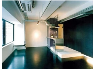
オシャレなワークスペースはエンジニアとしてのセンスに磨きがかかる!